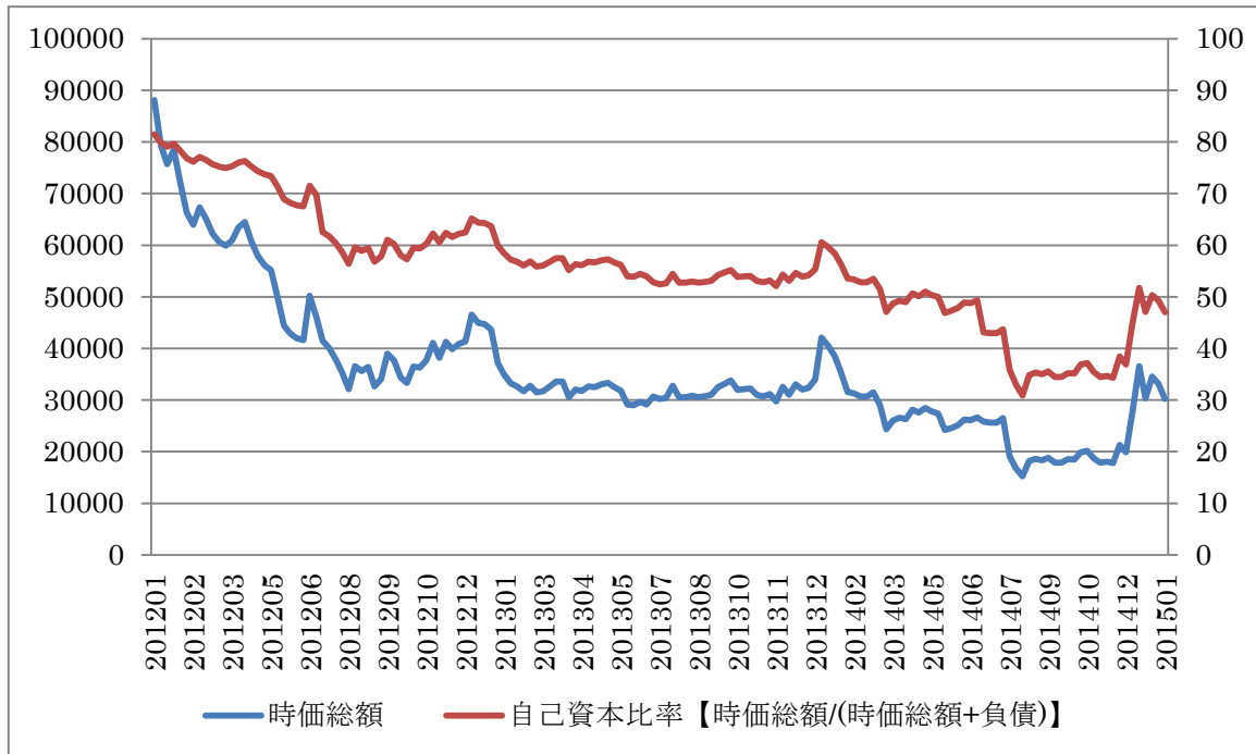
【左軸:時価総額（百万円）、右軸:自己資本比率（%）】

スカイマークは価格競争力を武器に、大手航空会社に対抗し成長してきた。2012年3月期の財務は過去最高益であったものの、2012年以降、格安航空会社の参入が目立ち競争激化で、株価は下落傾向にあった。また2014年3月期は、機材調達と燃料調達にネガティブな円安の影響も受け赤字となっている。