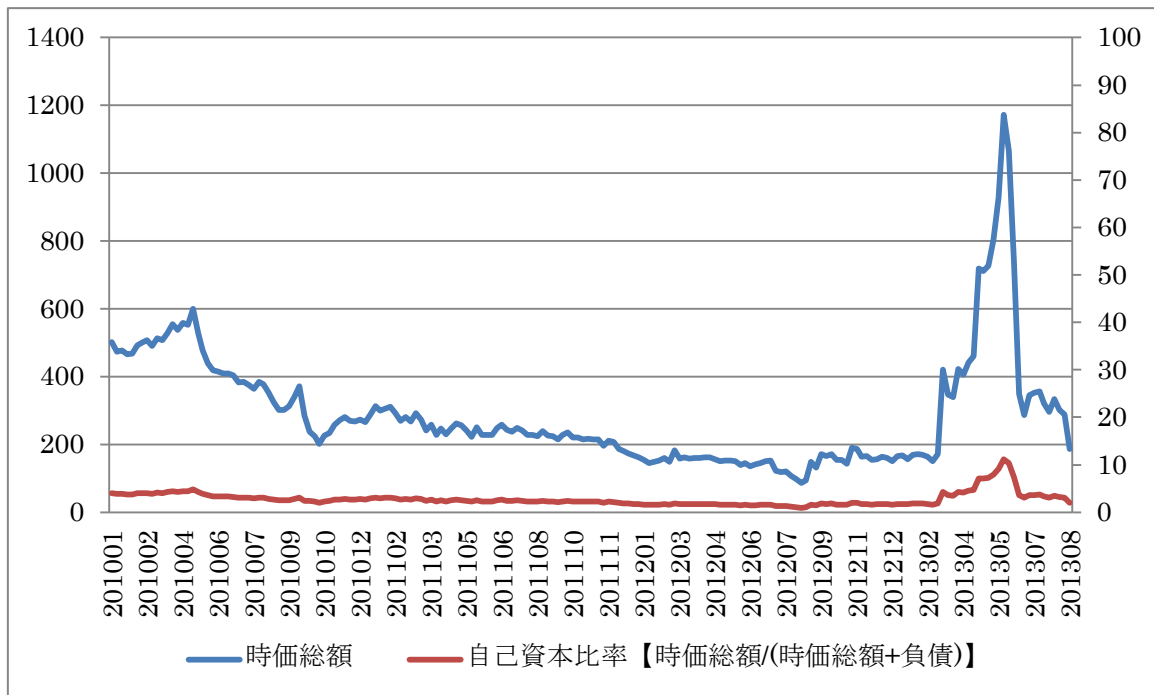
【左軸:時価総額 (百万円)、右軸:自己資本比率 (%)】

ワールド・ロジは顧客サービス強化のために大規模な設備投資を行い、積極的な展開を行ってきた。しかしながら規模の拡大の大半を借入金による調達で行っており、資金の確保が困難となった。2013年3月には事業再生ADRを申請した(注1)ものの、債権者の同意を得られなかったことから事業再生ADRが実行されなかった。(注2)なお、申請時に株価が一時的に上昇したが、ADR不成立と同時に急激に株価が下落している。再建支援のスポンサーが見つからず、単独での経営再建が難しいとの判断から、2013年8月30日に破産申請を行い受理された。