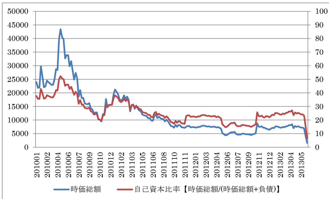
【左軸:時価総額（百万円）、右軸:自己資本比率（%）】

インデックスは、過去に自社で玩具やゲーム、メディアコンテンツなどを制作しており、2000年代中盤からは様々な企業への出資、買収を行って拡大戦略をとってきた。