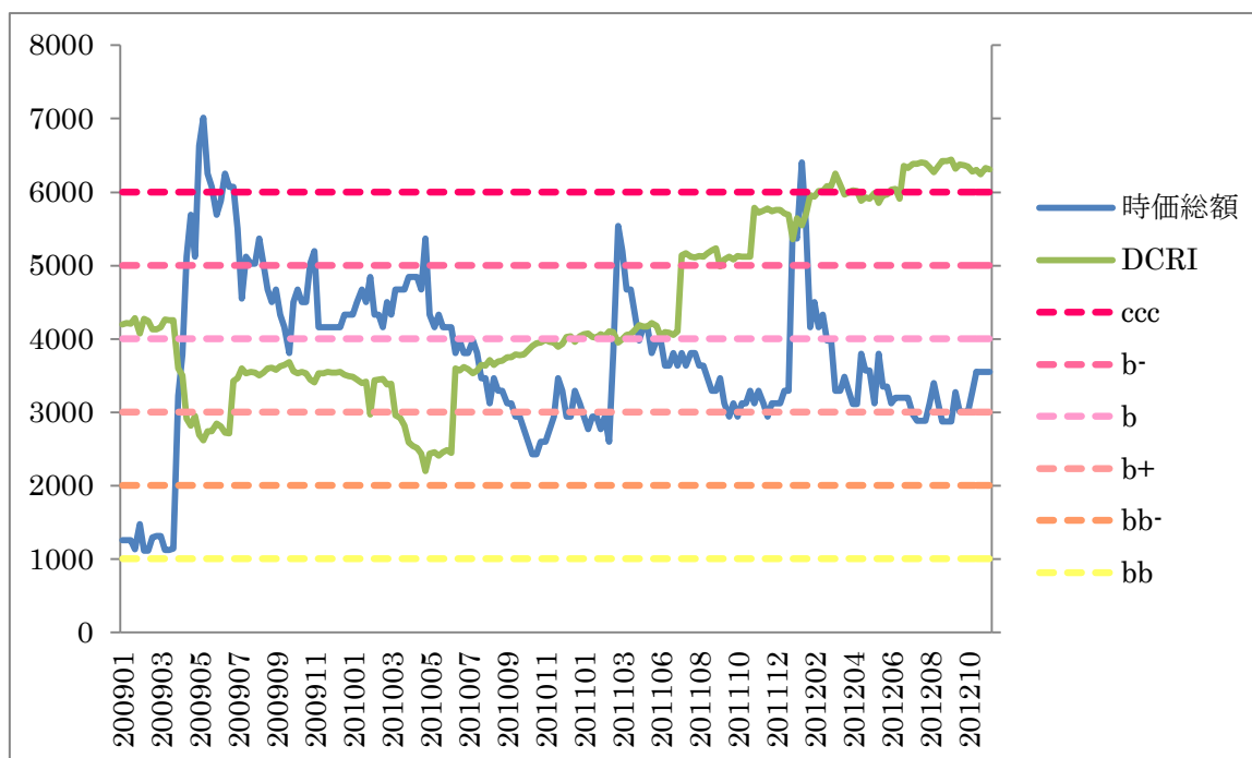
【左軸:時価総額（百万円）】

上場企業に対し、株価の変動と財務指標で信用力（DCRI）を測定する弊社製品 DEFENSE では、2009年初めの時点で当該企業を b+格で評価していた。その後の財務の悪化によって評価が順次下がることとなり、最終的には ccc 格まで推移していた。