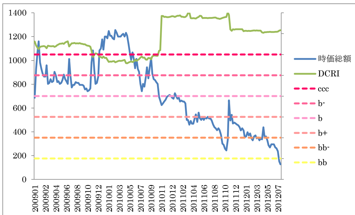
【左軸:時価総額（百万円）】

上場企業に対し、株価の変動と財務指標で信用力（DCRI）を測定する弊社製品 DEFENSE では、当該企業は 2009 年初めの時点で最も低い評価である ccc 格であった。一時的に回復の兆しを見せたが、2010 年 10 月以降 ccc 格のまま推移することになった。