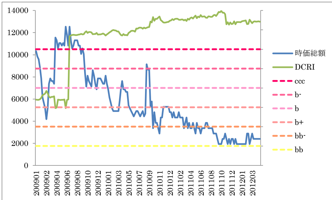
【左軸:時価総額（百万円）】

上場企業に対し、株価の変動と財務指標で信用力（DCRI）を測定する弊社製品 DEFENSE では、当該企業は 2009 年初めの時点で b であった。財務の悪化と株価の低下により徐々に評価を下げ、2009 年 7 月第 1 週以降、最も低い信用力評価（ccc）で推移していた。（上図参照）