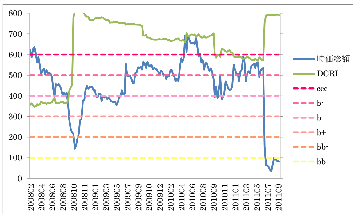
【左軸:時価総額（百万円）】

上場企業に対し、株価の変動と財務指標で信用力（DCRI）を測定する弊社製品 DEFENSE では、当該企業は上場時点の 2008 年当初より、b+格であった。株価の悪化、財務の悪化に連動して、徐々に信用力を下げていき、2011 年 6 月の急激な株価の下落によって、DEFENSE は評価上最も低い格付の ccc 格を示すことになった。