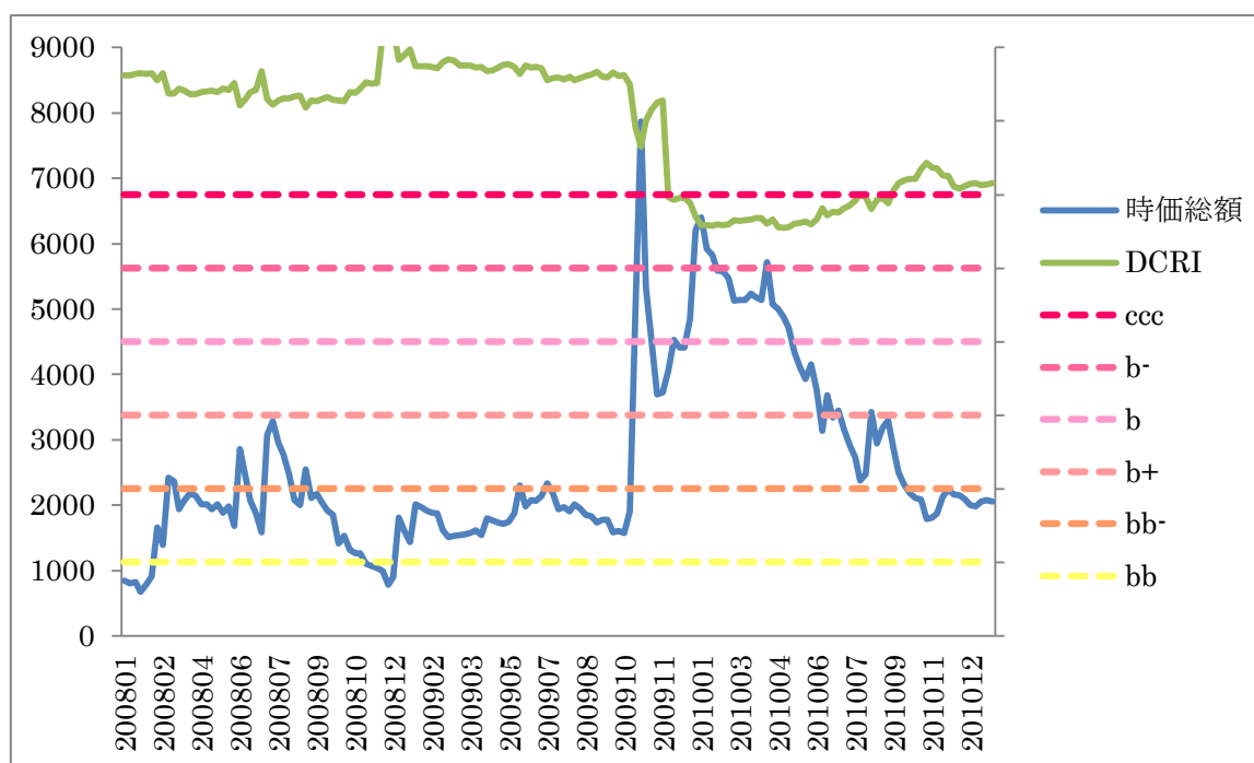
【左軸:時価総額（百万円）】

上場企業に対し、株価の変動と財務指標で信用力（DCRI）を測定する弊社製品 DEFENSE では、当該企業は 2008 年当初より、ccc 格であった。その後、株価の回復に伴って信用力を上げるも、最終的には再度 ccc 格に下落した。