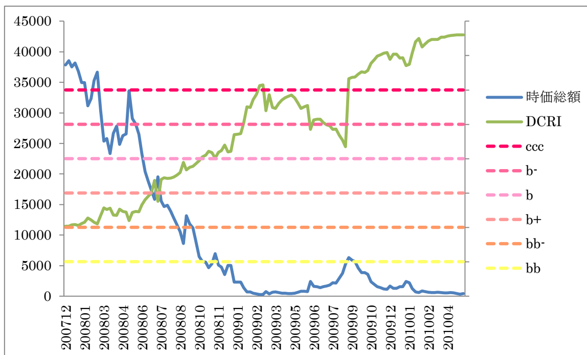
【左軸:時価総額（百万円）】

上場企業に対し、株価の変動と財務指標で信用力（DCRI）を測定する弊社製品 DEFENSE では、当該企業は評価開始時点である 2007 年 12 月より、bb-格であった。株価の悪化、財務の悪化に連動して、徐々に信用力を下げていき、2009 年 9 月第 1 週以降は DEFENSE が評価する最も低い格付の ccc 格となり、この格付が倒産時点まで続くことになった。